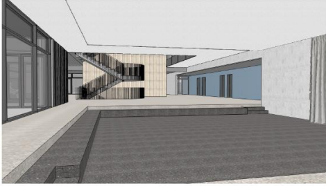
Blick von der Bühne zur gem. Mitte