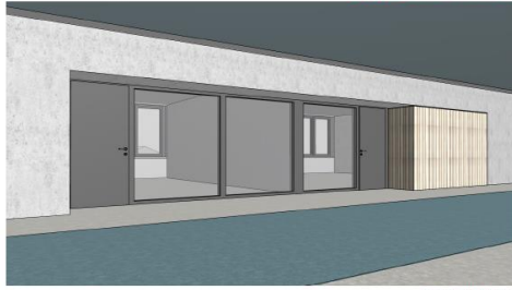
Zugang zu den Klassen