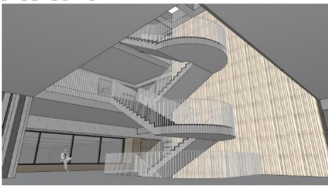
Treppe der gemeinsamen Mitte